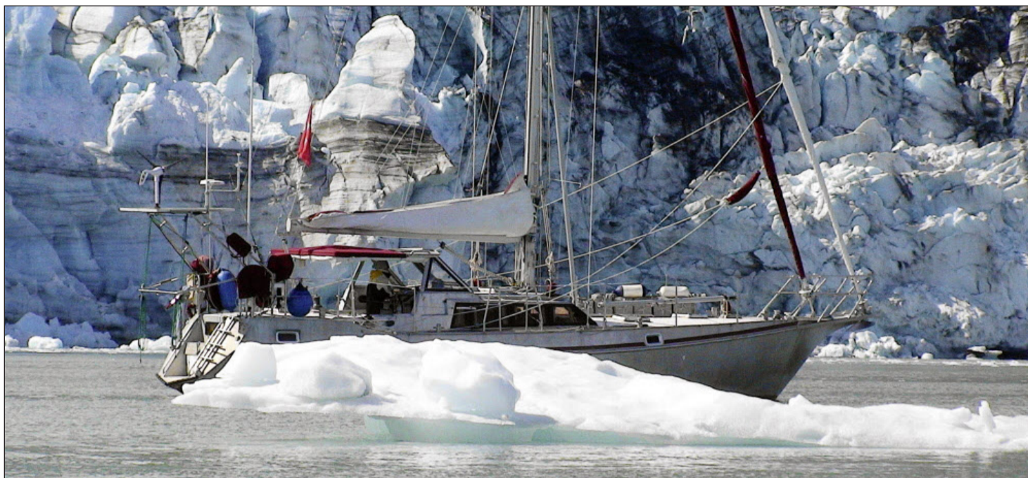
Die «Momo» 2008 vor dem Lamplugh-Gletscher im Glacier-Bay-Nationalpark, Alaska.